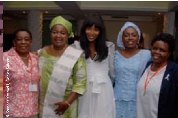
© Sameer Kermalli, Dar es Salaam